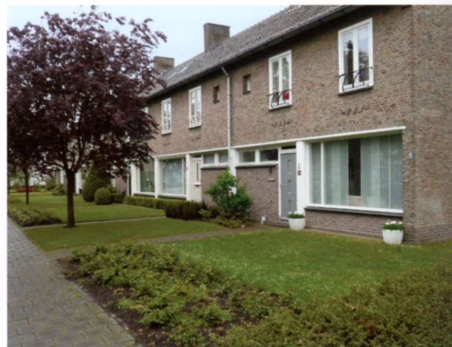
Combinatie van traditionele en moderne vormgeving

medewerkers in Eindhoven en omgeving werden gebouwd. 10 De verkaveling van het vroegste deel, noordelijk van de Brink, bestaat vooral uit noord-zuidgerichte straten die kleine hoekverdraaiingen maken en uitkomen op de Nieuw Erfseweg. Halverwege de Beneden Beekloop buigen de gevelwanden uiteen, zodat een schegvormige groene ruimte is ontstaan. In de Rulstraat bevindt zich een klein plantsoen met eveneens een driehoekige vorm.