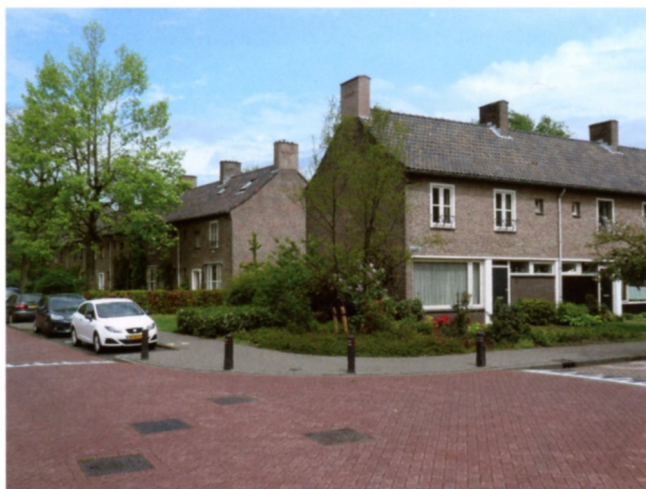
Hybride woning hoek Groesstraat Rulstraat