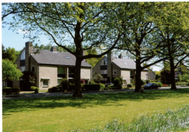
Moderne woning aan het Eversveld

Dezelfde knik in het dakvlak komt ook voor in reeksen zogeheten Finse woningen, ontworpen door het Philips Woningbedrijf. Deze rijen staan aan dezelfde straten als de andere reeks, vaak aan de overkant, aan de Meers, Wisse en Slinge en het noordelijkste deel van de Beneden Beekloop. Opvallend aan deze woningen is de gevelbetimmering van brede witte verticale houten delen op de slaapverdieping boven de smalle donkere houten latten op de begane grond. Betonnen penanten markeren de afzonderlijke woningen en beëindigen de houten delen. Bij deze woningen zijn de raamopeningen op de verdieping weer een stuk kleiner dan op de woonlaag.