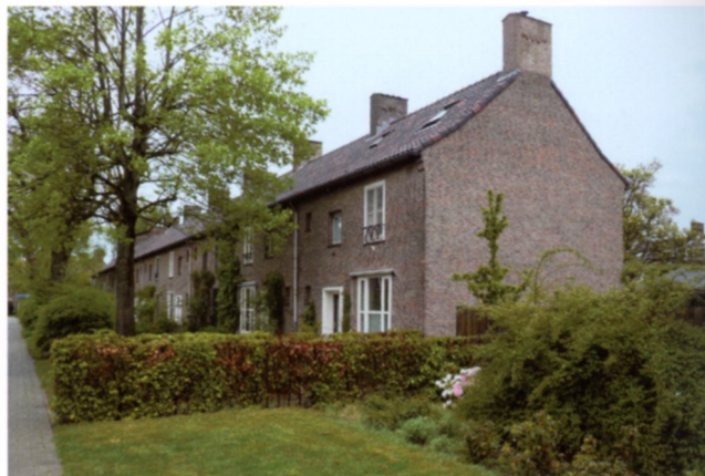
Raampartijen ontleend aan Amersfoortse ontwerpen