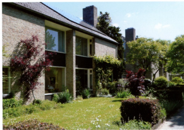
Hoge puinen en grote muurvlakken

De in de rijwoningen gebruikte puiconstructie met overnaadse delen stond destijds voor moderne architectuur en is ook bij de duurdere typen toegepast. Bij de tweekappers liggen deze puinen echter achter het gevelvlak, als een soort negatieve erker, van elkaar gescheiden door een gemetselde penant. Dankzij een smal omgezet hoekraam, haaks op de gevel, kan men van binnenuit langs de voorgevel kijken. Meer dan de helft van de voorgevel bestaat uit massief metselwerk met alleen een vrijwel vierkant raam op de begane grond. De kopgevel is weer relatief open met twee van dergelijke ramen en een pui over de gehele hoogte met daarin de entree en ramen op zowel de verdieping als de