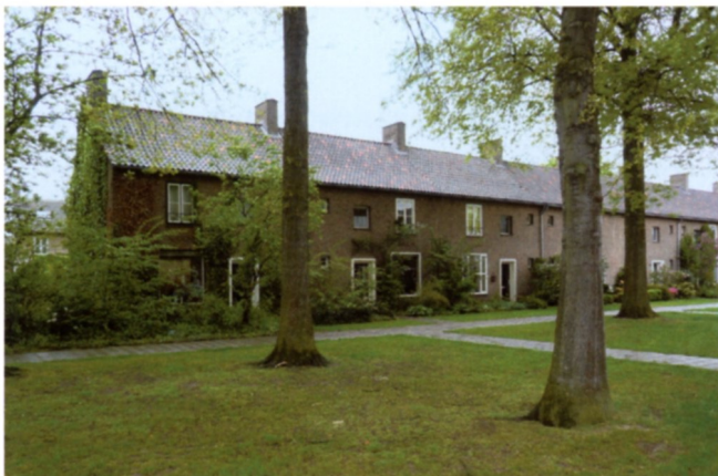
Traditionele woning aan de Beneden Beekloop